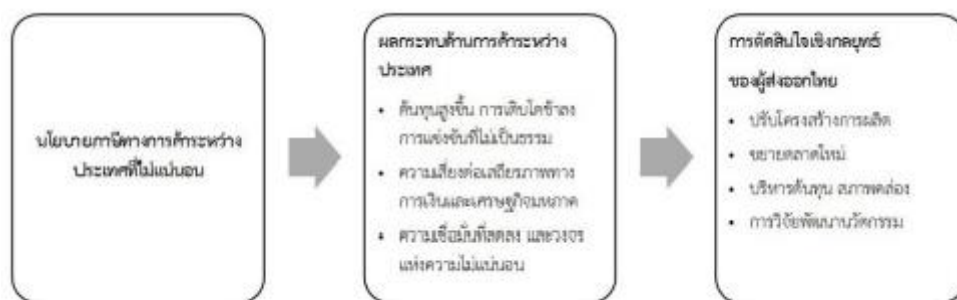
ภาพ 2 กรอบแนวคิด

จากการทบทวนวรรณกรรมที่เกี่ยวข้องกับกับผลกระทบและการตัดสินใจเชิงกลยุทธ์ของผู้ส่งออกไทยจากนโยบายภาษีทางการค้าระหว่างประเทศ ผู้วิจัยได้สังเคราะห์ประเด็นสำคัญและปัจจัยที่เกี่ยวข้องเพื่อนำมาใช้เป็นแนวทางในการกำหนดกรอบแนวคิดของการวิจัยในครั้งนี้ ผู้วิจัยจึงได้กรอบแนวคิด ดังนี้