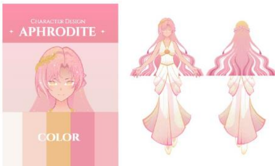
ภาพ 2 แสดงภาพตัวละครอะโฟรไดต์

โศกนาฏกรรมรัก มีตัวละครที่ถูกออกแบบโดยอิงลักษณะมาจากตำนานเทพปกรณัมกรีก โดยคงไว้ซึ่งเอกลักษณ์ทางกายภาพที่โดดเด่นและงดงามตามความเชื่อ มีการปรับแต่งรูปลักษณ์ ลายเส้น และบุคลิกภาพให้เหมาะสมกับแนวทางของเรื่อง เพื่อให้ตัวละครดูมีเสน่ห์และสื่อสารอารมณ์ได้อย่างชัดเจน