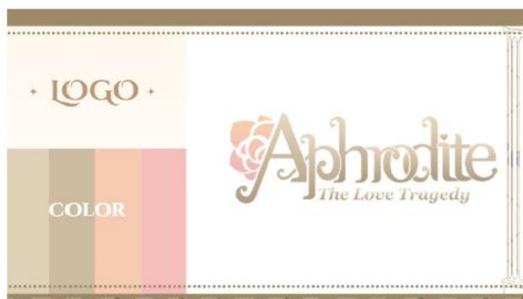
ภาพ 3 แสดงการออกแบบโลโก้

การผลิตสื่อแอนิเมชันเวกเตอร์ 2 มิติ เรื่อง โศกนาฏกรรมรักของอะโฟรไดต์และอะโดนิส ได้ดำเนินการเสร็จสมบูรณ์เป็นที่เรียบร้อยแล้ว โดยผู้วิจัยได้ผลิตสื่อแอนิเมชันเวกเตอร์ 2 มิติ อย่างครบถ้วน โดยสามารถสรุปผลการวิจัยได้ดังนี้