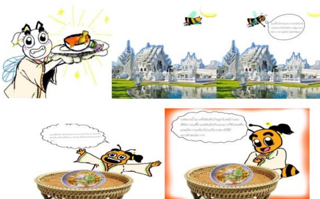
ภาพ 3 แสดงภาพตัวละครผึ้งนำทางอาหารไทยภาคเหนือ