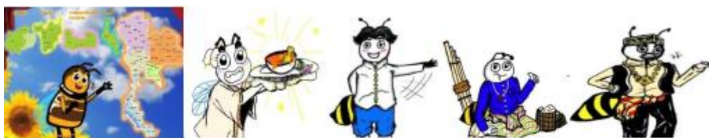
ฝั่งนำทาง