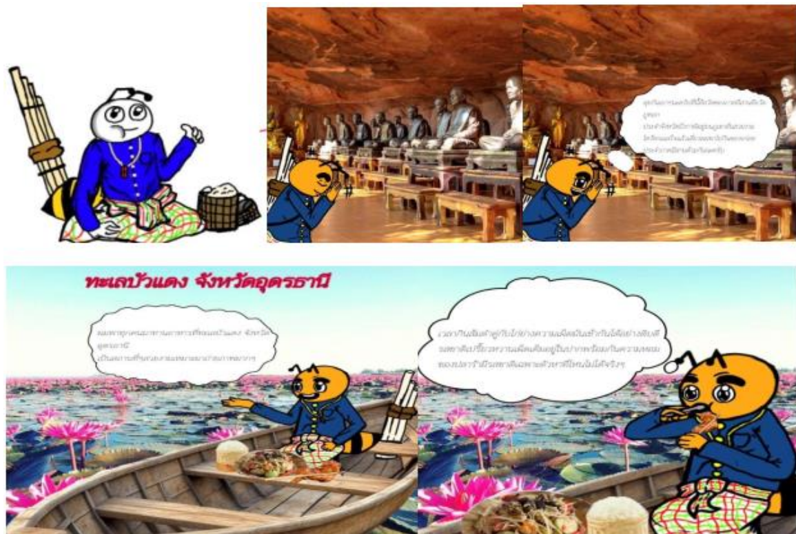
ภาพ 5 แสดงภาพตัวละครผึ่งนำทางอาหารไทยตะวันออกเฉียงเหนือภาคเหนือ (อีสาน)

ผึ่งอาหารไทยภาคตะวันออกเฉียงเหนือ (อีสาน)