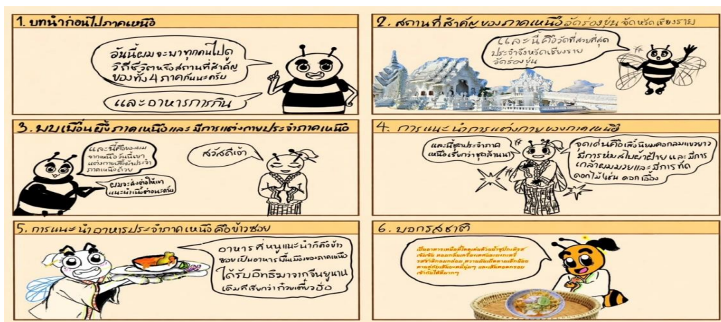
ภาพ 1 แสดงภาพเรื่องราวลำดับเหตุการณ์ผึ้งนำทางอาหารภาคเหนือ

จากภาพ 1 แสดงการนำเสนอเรื่องราวเกี่ยวกับ อาหารพื้นบ้านภาคเหนือ โดยมีตัวละคร ผึ้งเป็นผู้ดำเนินเรื่องลำดับเหตุการณ์ได้ดังนี้