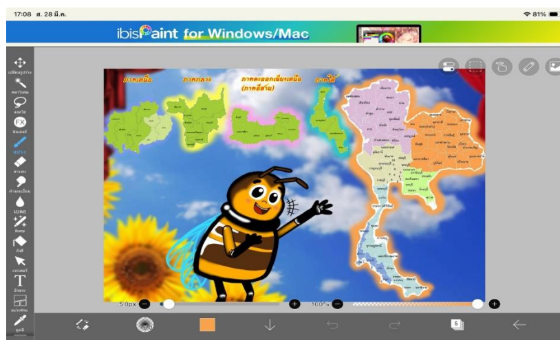
ภาพ 7 แสดงการสร้างสื่อแอนิเมชัน การใส่สี เคลื่อนไหว และจัดแสง

ดำเนินการสร้างการ์ตูนแอนิเมชัน โดยใช้โปรแกรมไอบิสเพนท์ X