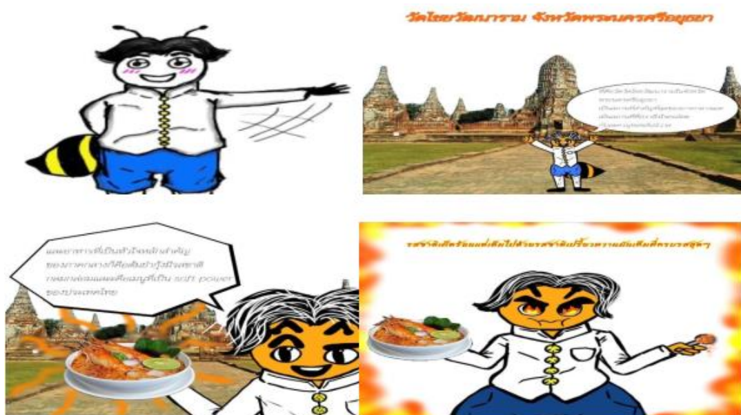
ภาพ 4 แสดงภาพตัวละครฝั่งนำทางอาหารไทยภาคกลาง

จากภาพ 4 แสดงการออกแบบตัวละครฝั่งนำทางอาหารไทยภาคกลาง เพื่อสะท้อนถึงเอกลักษณ์ของพื้นที่ภาคกลาง มีรายละเอียดดังนี้