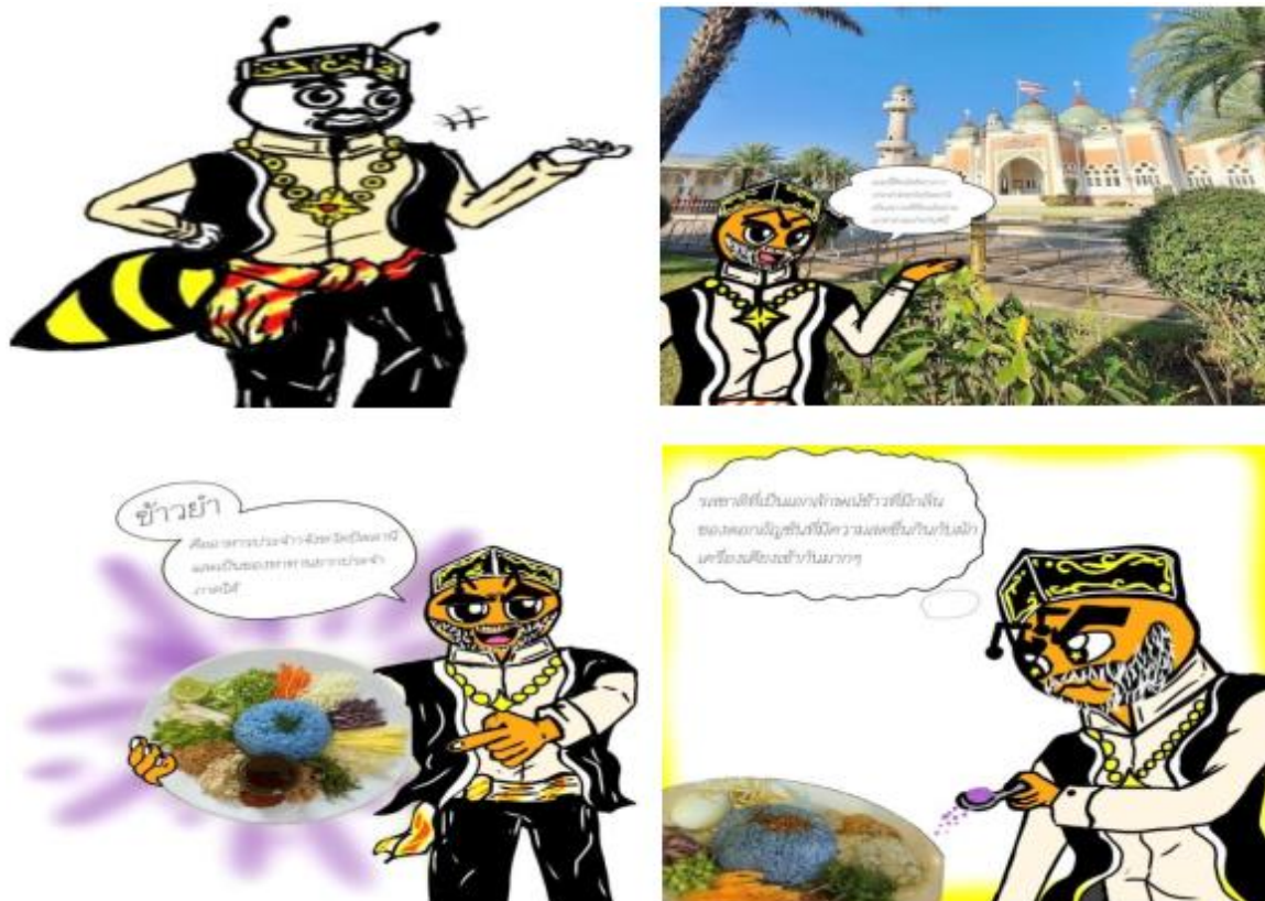
ภาพ 6 แสดงภาพตัวละครผึ้งนำทางอาหารไทยภาคใต้

จากภาพ 6 แสดงการออกแบบตัวละครผึ้งนำทางอาหารไทยภาคใต้ ซึ่งมุ่งเน้นการสะท้อนเอกลักษณ์ทางวัฒนธรรมของภาคใต้ตอนล่างดังนี้