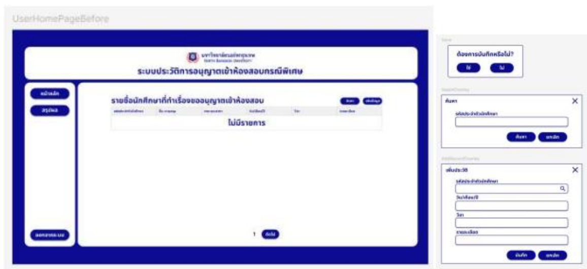
ภาพ 3 และ 4 ออกแบบระบบในส่วนของผู้ใช้งานทั่วไปผ่านโปรแกรม Figma