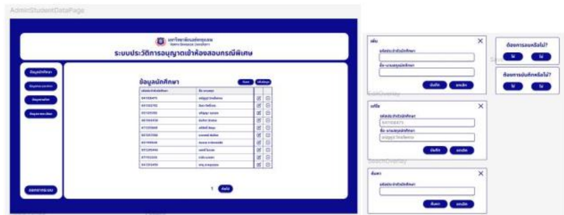
ภาพ 5 และ 6 ออกแบบระบบในส่วนของผู้ดูแลผ่านโปรแกรม Figma